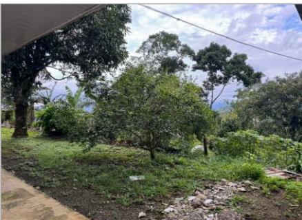
VISTA GENERAL PROPIEDAD