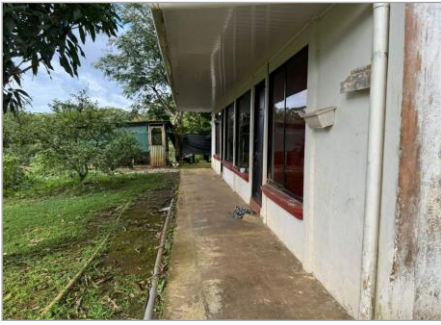
VISTA FRONTAL VIVIENDA2