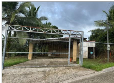
VISTA FRONTAL PROPIEDAD