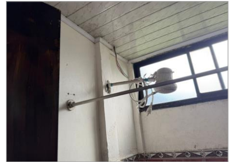
CABLES SIN ENTUBAR