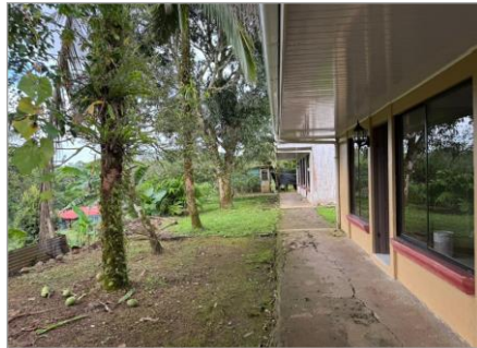
VISTA EXTERNA VIVIENDA1