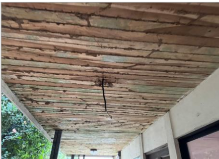
COMEJEN Y PLAFON FALTANTE