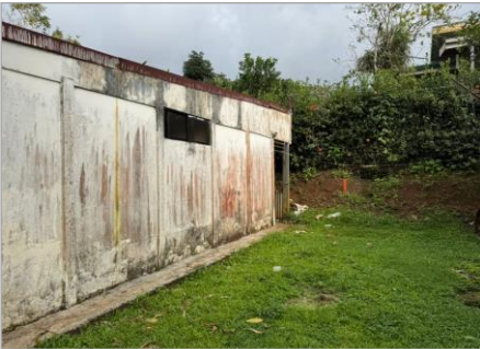
VISTA EXTERNA VIVIENDA1