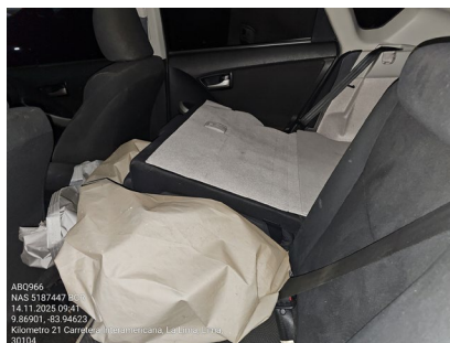
VISTA DE ASIENTOS POSTERIORES

Fecha de la inspección 14 de noviembre de 2025