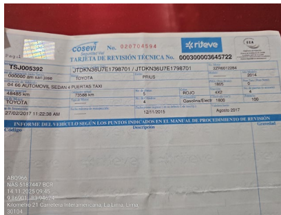
BOLETA DE REVISIÓN TÉCNICA