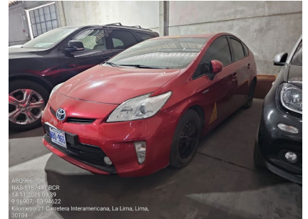
VISTA LATERAL IZQUIERDA