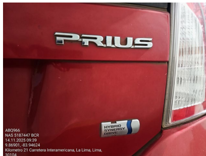
EMBLEMA DE MODELO