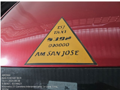
VISTA DEL TECHO