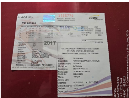
DERECHO DE CIRCULACION