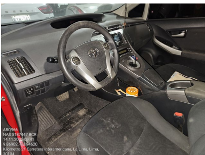
VISTA GENERAL DE CABINA