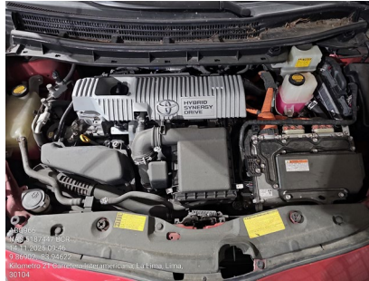
VISTA DEL MOTOR