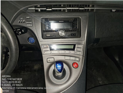
PANEL DE RADIO Y A/C