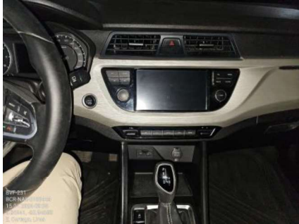
PALANCA DE CAMBIOS AUTOMÁTICA