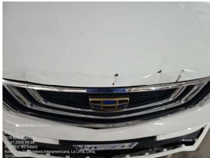
DAÑO EN CAPÓ DEL MOTOR