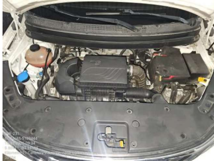
VISTA DEL MOTOR