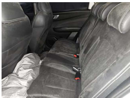
VISTA DE ASIENTOS POSTERIORES

Fecha de la inspección 15 de enero de 2025