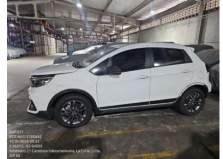
VISTA LATERAL IZQUIERDA