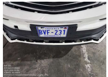
FALTA DE FIJACIÓN DE MOLDURA EN BÚMPER DELANTERO

Fecha de la inspección 15 de enero de 2025