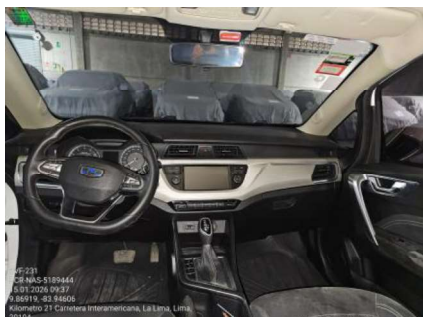
VISTA GENERAL DE CABINA