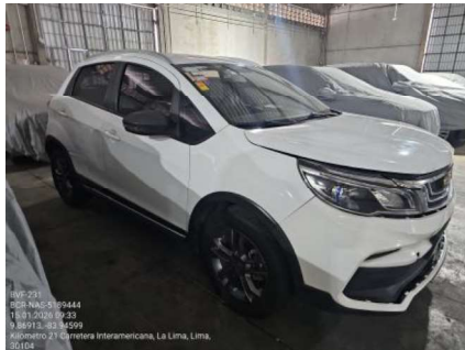
VISTA LATERAL DERECHA