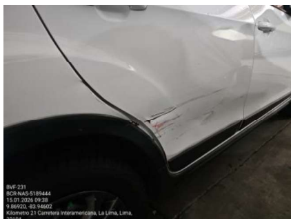
GOLPE EN PUERTA TRASERA Y GUARDABARRO