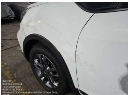
GOLPE EN GUARDABARRO Y PUERTA