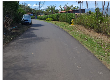
Entorno de propiedad