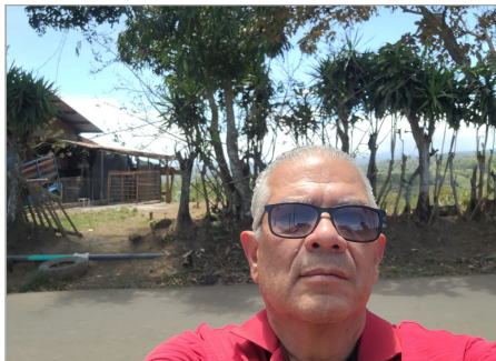
Perito en sitio