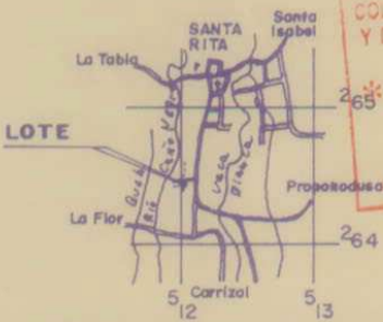
UBICACION GEOGRAFICA HOJA RIO CUARTO ESCALA 1 : 50000

COLEGIO FEDERADO DE INGENIEROS Y DE ARQUITECTOS DE COSTA RICA RECIBIDO 26 OCT 2001