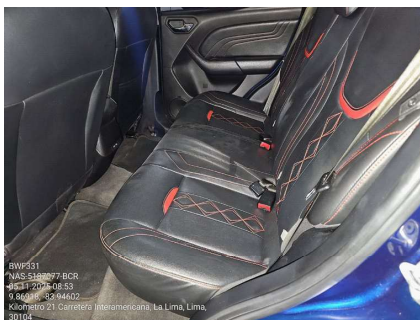
VISTA DE ASIENTOS POSTERIORES