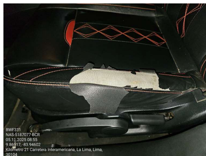
DAÑO EN TAPICERIA