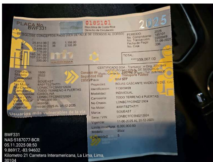
DERECHO DE CIRCULACION