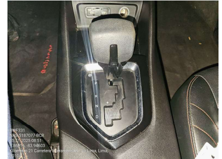
PALANCA DE MARCHAS