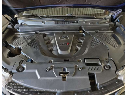
VISTA DEL MOTOR