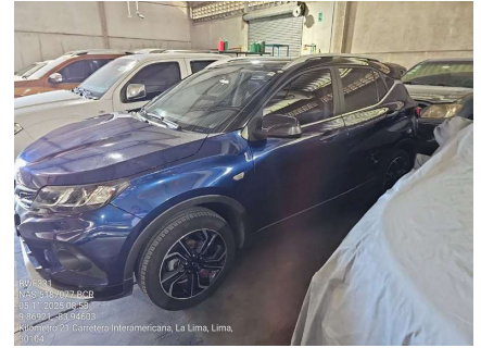
VISTA LATERAL IZQUIERDA