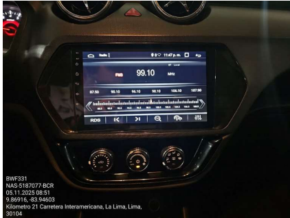
PANEL DE RADIO Y A/C