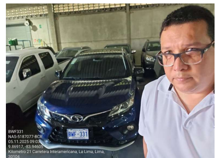
VALUADOR EN SITIO

Fecha de la inspección 5 de noviembre de 2025