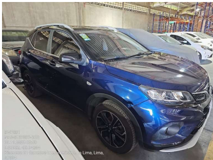
VISTA LATERAL DERECHA