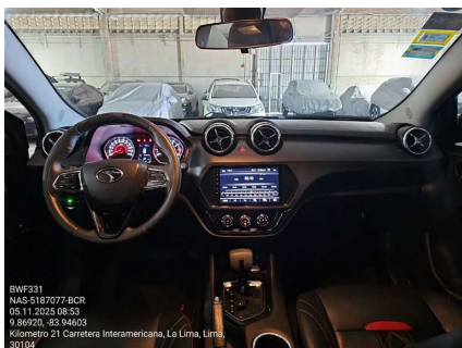
VISTA GENERAL DE CABINA