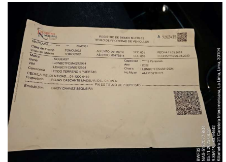
TÍTULO DE PROPIEDAD