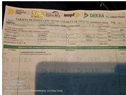
BOLETA DE REVISIÓN TÉCNICA