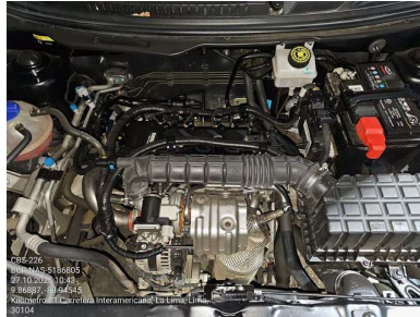
VISTA DEL MOTOR