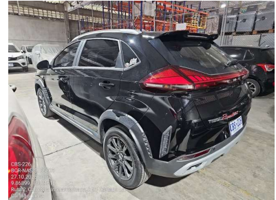
VISTA LATERAL IZQUIERDA