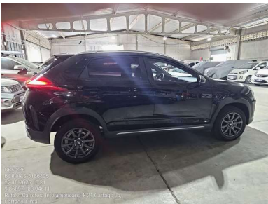
VISTA LATERAL DERECHA