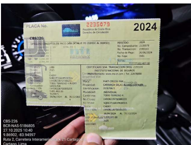
DERECHO DE CIRCULACION