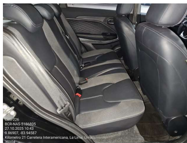
VISTA DE ASIENTOS POSTERIORES