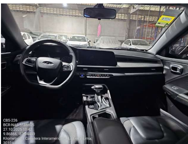
VISTA GENERAL DE CABINA