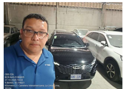
VALUADOR EN SITIO

Fecha de la inspección 27 de octubre de 2025