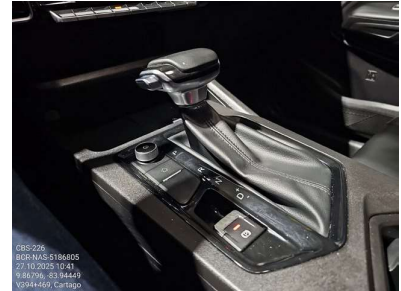
PALANCA DE MARCHAS