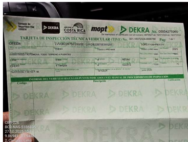
BOLETA DE REVISIÓN TÉCNICA