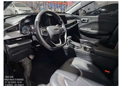
VISTA DE CABINA