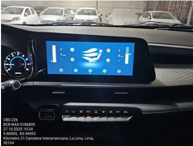
PANEL DE RADIO Y A/C