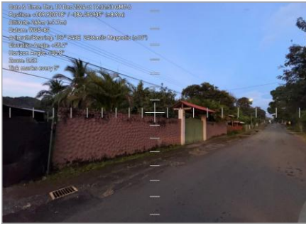
Frente de la finca desde sector suroeste