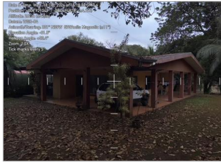
Exterior de la vivienda